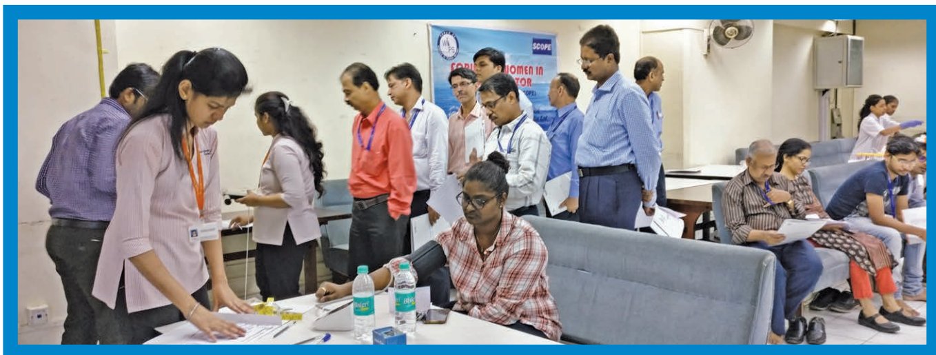
WIPS-SCI in association with Appolo Clinic organised a health check-up camp on 7th April 2017 for all the SCI employees