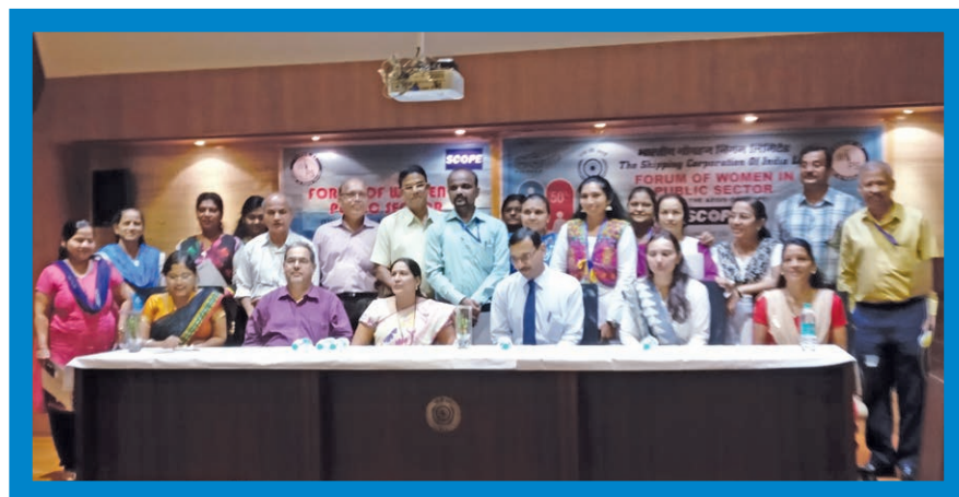
The overwhelming response of health Check up plan for entire SCI staff resulted in organising "International Happiness Day" – an Interactive session with Doctors about "Winning the Weight" on 11th April 2017 at SCI Auditorium