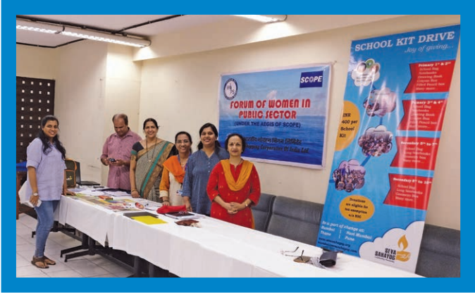
Through an NGO named Seva Sahyog, SCI organized a School Kit Donation Drive on 5th May 2017