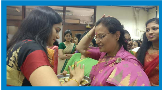
SCI celebrated Haldi Kumkum festival on 27th January 2017