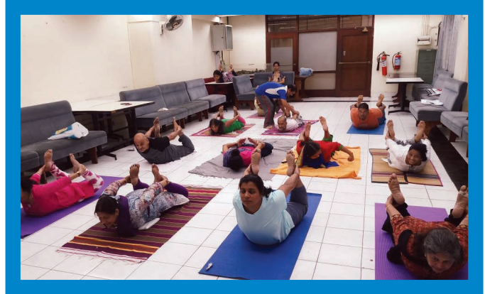
WIPS SCI committee along with "Ambika Yog Kutir" had organised 12 weeks Yoga certificate course for the employees of SCI on 7th September 2017