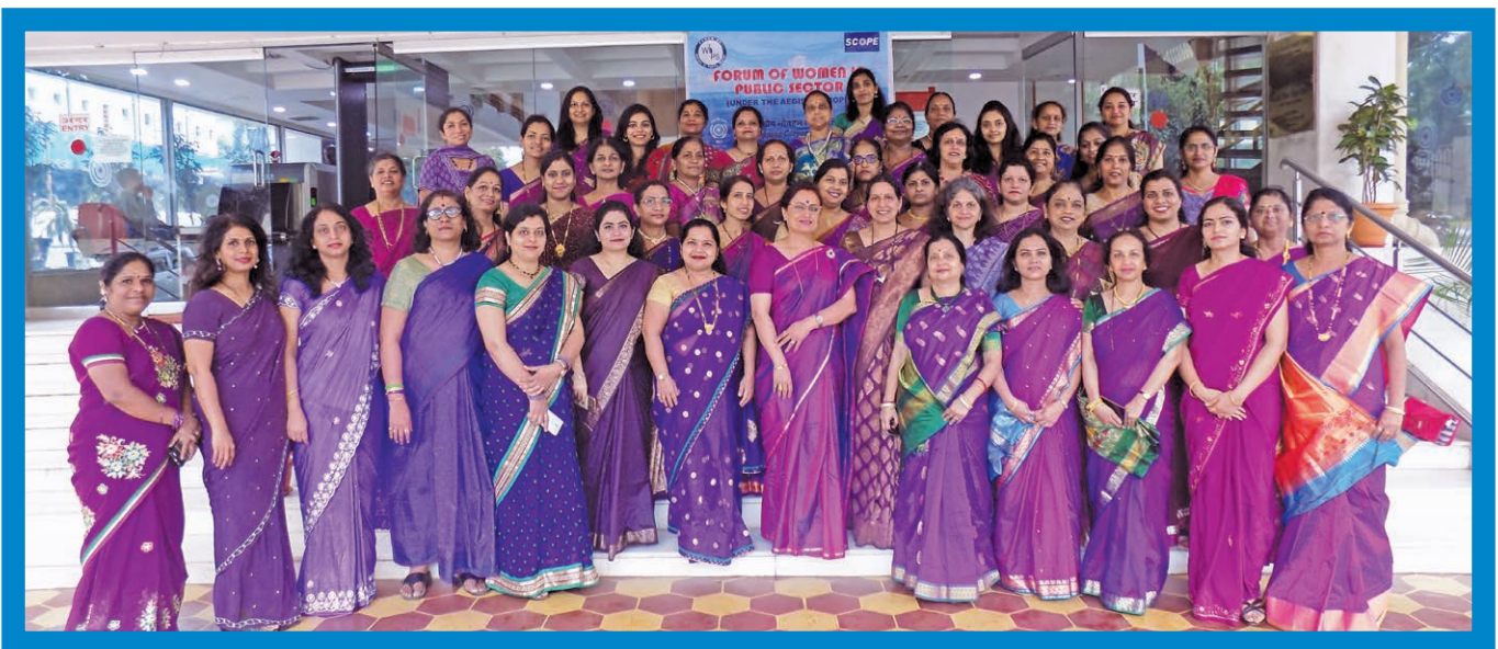
SCI WIPS observed the auspicious festival of Navaratri with Navaratri Celebration from 21st September to 29th September, 2017