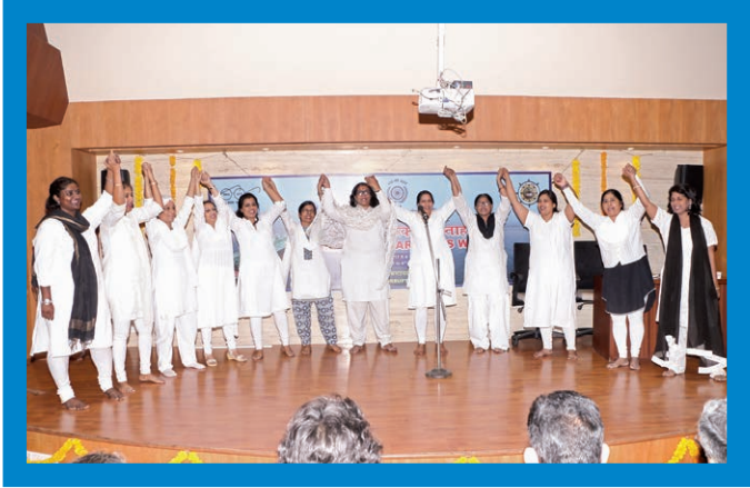
SCI WIPS Committee Members played a skit on 3rd November 2017 during Vigilance Awareness Week on the theme - "MY VISION – CORRUPTION FREE INDIA"