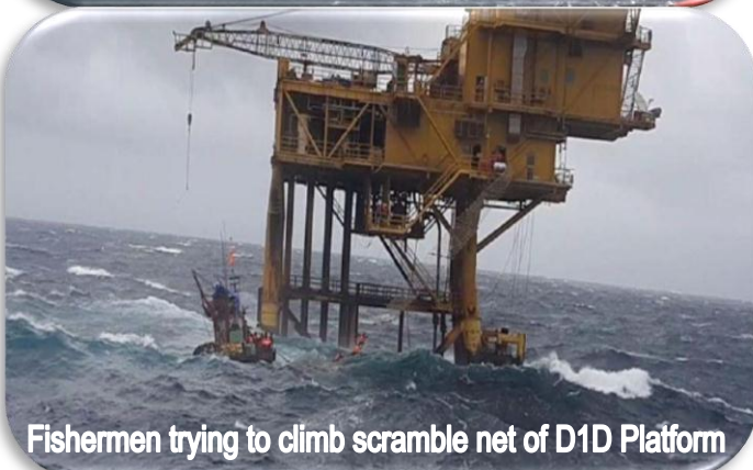
Fishermen trying to climb scramble net of D1D Platform