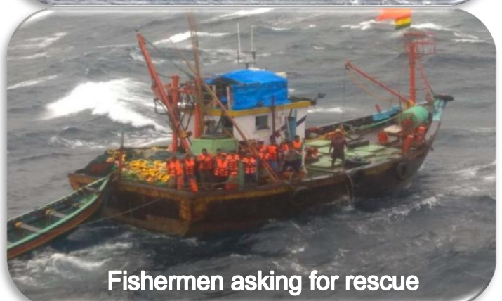
Fishermen asking for rescue