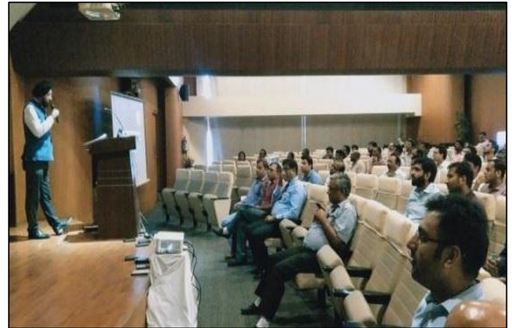
As part of several initiatives to enhance the executive engagement and provide opportunities to accelerate their learning and development, an inter-divisional competition called SCI Inquisitive Quiz Challenge was launched at SCI couple of months back.