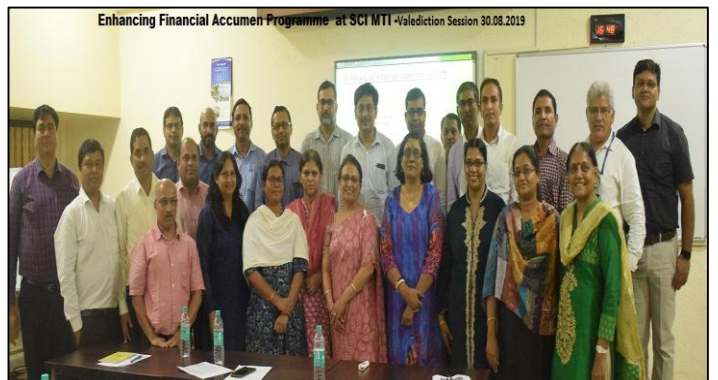
Enhancing Financial Acumen Programme at SCI MTI -Validation Session 30.08.2019