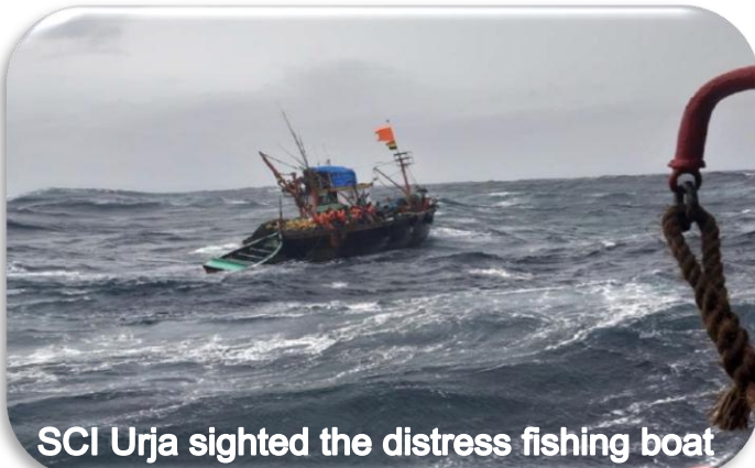
SCI Urja sighted the distress fishing boat

Due to quick and effective assistance rendered by 'SCI Urja' in such challenging circumstances, life of all 18 fishermen could be saved without any reported major injury.