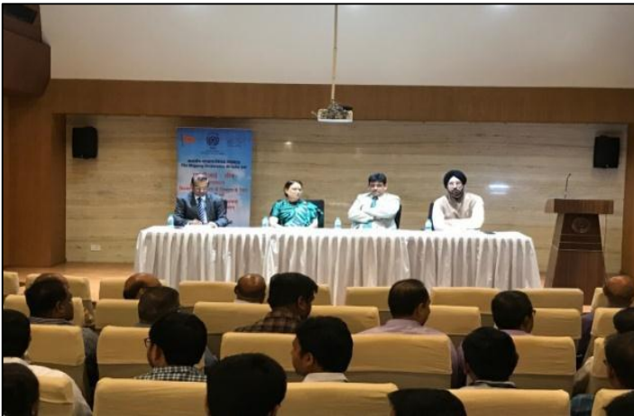
SCI LEAP, an initiative with a view to sensitize employees regarding the challenges faced by SCI due to market dynamics and also to involve employees to come-up with ideas / solutions to improve operational efficiency, was conducted in August 2019.