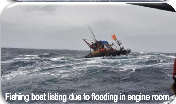
Fishing boat listing due to flooding in engine room