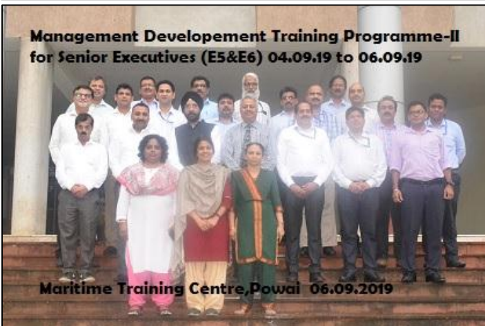
Management Development Programme-II for Senior Executives (E5&E6) 04.09.19 to 06.09.19