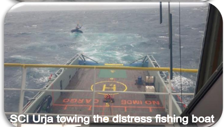
SCI Urja towing the distress fishing boat